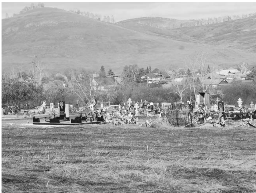
Новая часть кладбища