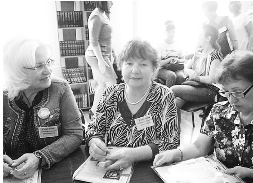
На краевом чемпионате по компьютерному многоборью

Жизнь не стоит на месте, она изменяется практически ежедневно. И то, что раньше было приоритетом молодых, сейчас открывается людям старшего поколения и становится частью их образа жизни.