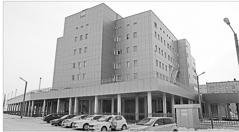
Удобные подъезды к лечебному корпусу позволяют доставить пациента до двери, для автомобилей предусмотрена отдельная парковка