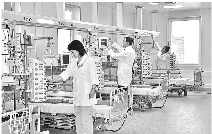
В новых корпусах решены все вопросы с вентиляцией, обеззараживанием воздуха, климат-контролем

Строители не подвели: точно по графику, почти день в день, как и обещали лично губернатору, три новых корпуса крупнейшего в Сибири онкологического центра, построенные в рекордные сроки, открыли двери для пациентов. Их уже переводят в палаты, скоро начнутся первые операции. Этого события жители края ждали много лет.