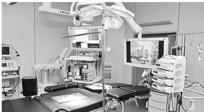
Из каждой операционной врач может выйти на связь с Москвой или отдаленным районом края и провести телеконсультацию