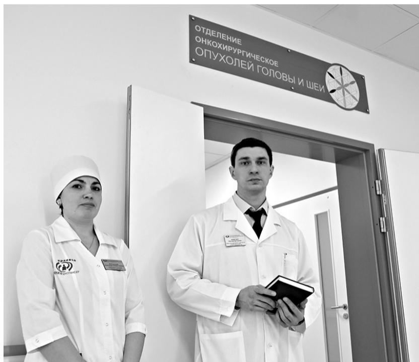
Готовить кадры для растущего онкоцентра начали еще на стадии согласования проекта