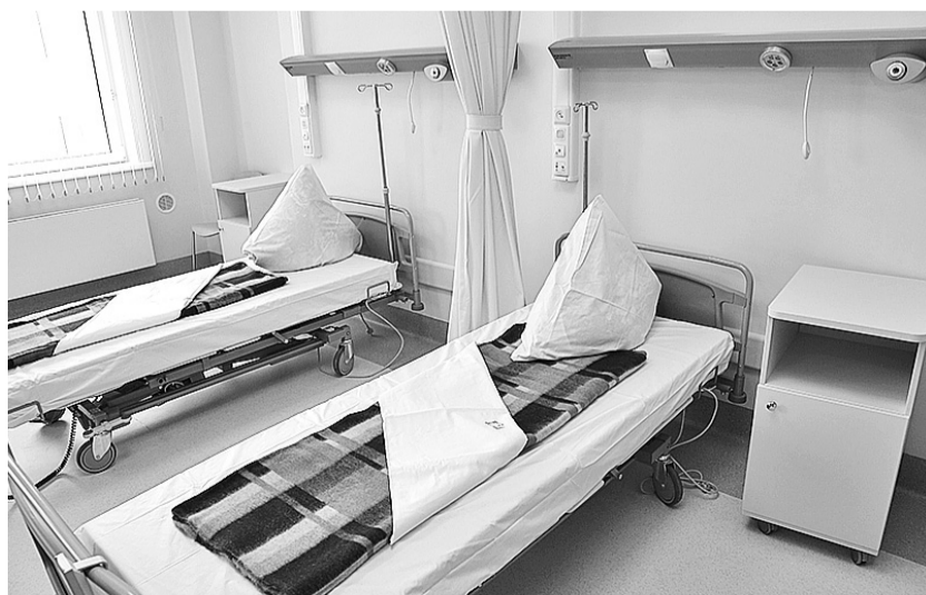
Функциональные кровати могут принять любое положение с помощью пульта