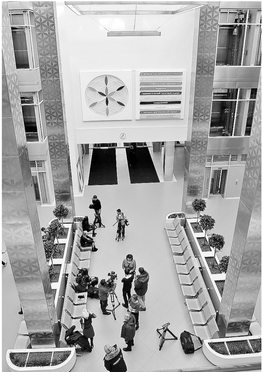
Просторный холл для встреч пациентов и их близких