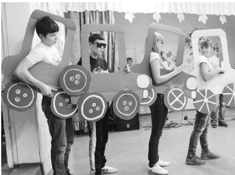
Команда «БЭМС», Отрокская сош

Не отстает в работе по этому направлению и Идринский район. На территории восьми сельских поселений района в течение лета действовало 10 трудовых отрядов старшекласников. Какой объем работы удалось выполнить ТОСовцам? Насколько уютнее стали наши школы и села? Скольким людям помогли наши активисты-труженики? Ответы на эти вопросы мы узнали на традиционном шестом районном слете трудовых отрядов «Панорама трудовых дел».