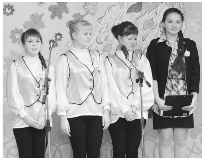
Команда «Юность», Большехабыкская сош

Молодое поколение энергичных, прекрасных, перспективных ребят пришло в Дом детского творчества, чтобы представить результаты работы летнего трудового сезона. Это отряды «Тимуровцы», (Идринская сош), «БЭМС» (Отрокская сош), «Радуга» (Романовская сош), «ОМОН» (Добромысловская сош), «Юность» (Большехабыкская сош).