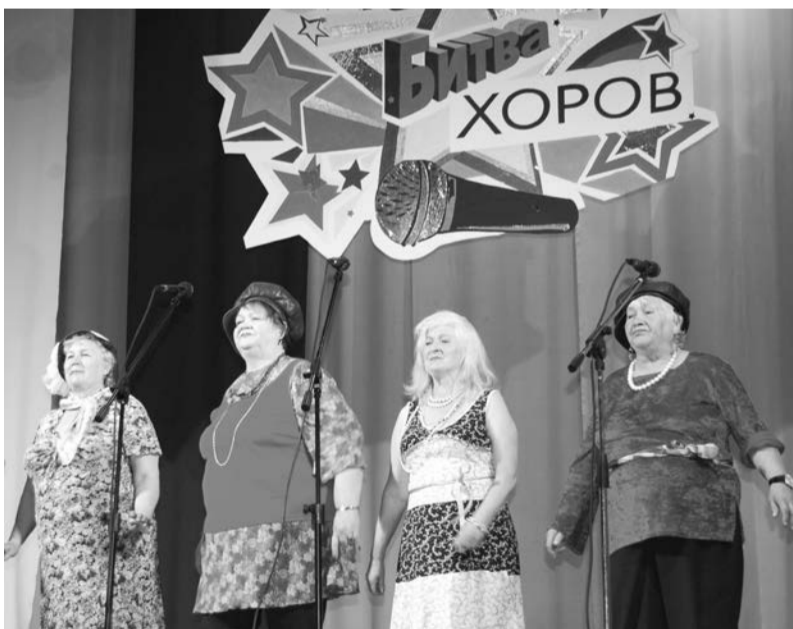
Народный хор «Ивушка» исполняет шансон

Вы можете быть со мной не согласны, но если мне предложили быть в составе жюри, я выражаю свое мнение».