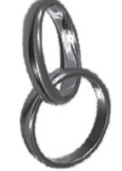
Мама, папа (2168)

День свадьбы – праздник самый важный, День свадьбы – день рождения семьи, Друг друга повстречали вы однажды, И загорелась ярко искорка любви. Желаю вам, чтоб никогда она не гасла, А лишь сияла с каждым днем сильней, Чтоб жизнь семейная была прекрасна, Пусть будет очень много счастья в ней!