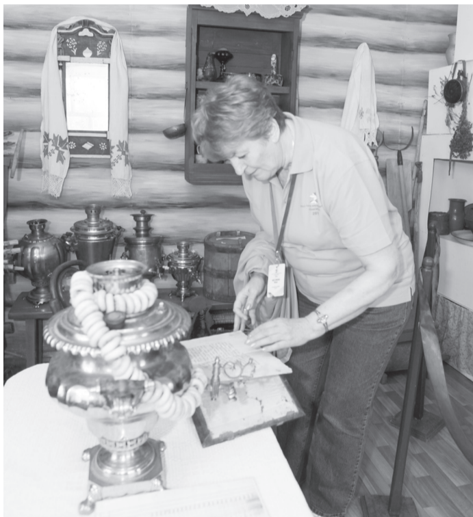
В музее имени Николая Летягина