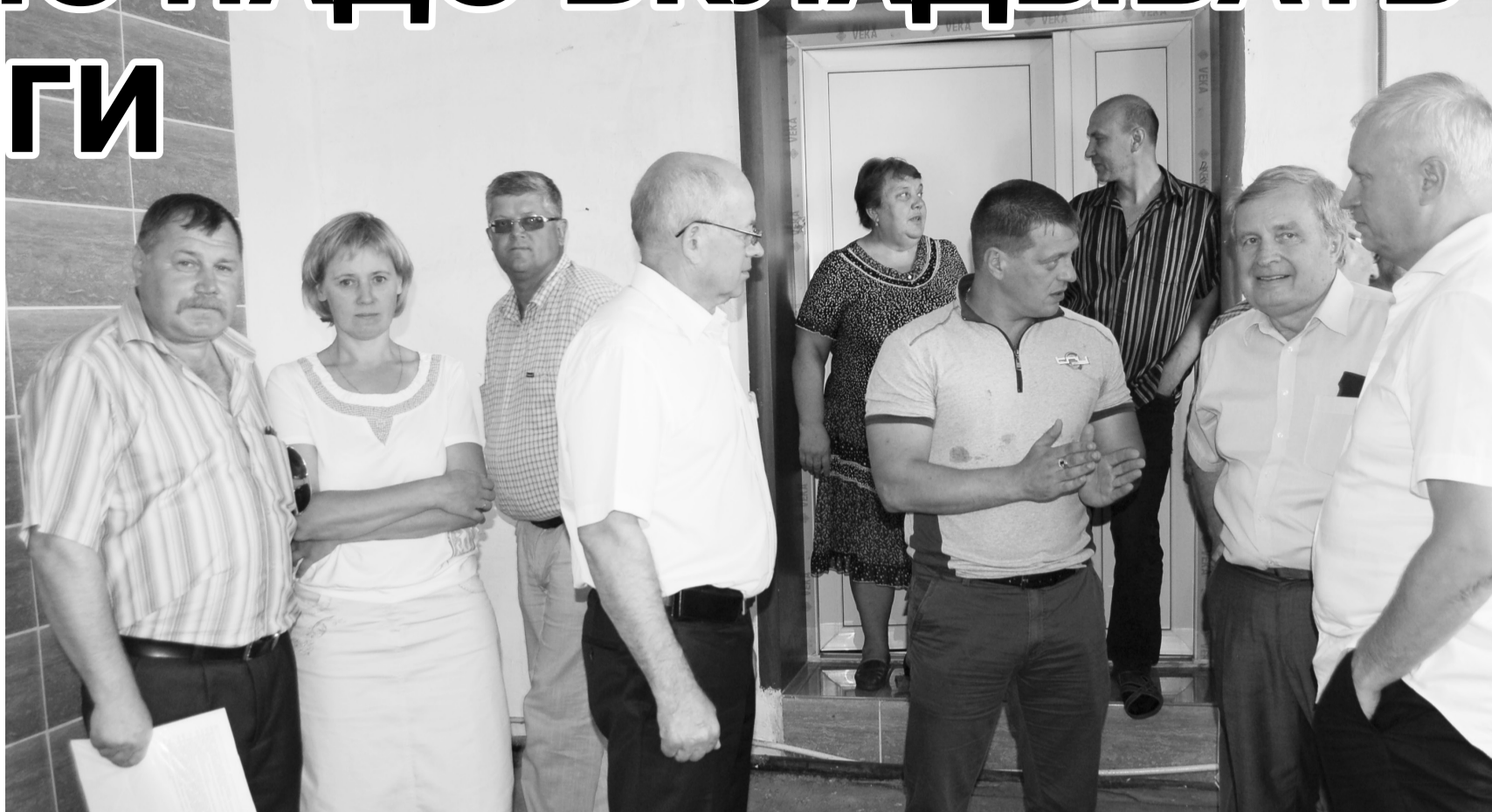
Посещение кооператива «Гавань»