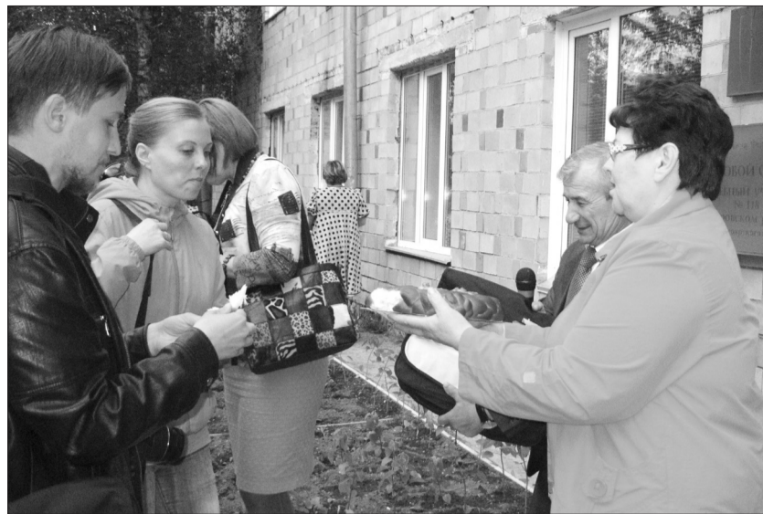
Хлеб и соль от главы администрации Пировского района

За непродолжительный период деятельности Центр ремесел выиграл 12 грантов. На полученные средства закуплен необходимый материал для занятий, имеется специальная печь для обжига изделий из глины и создания шедевров из расплавленного стекла. Работают семейный клуб «Ласточкино гнездо», ресурсный центр поддержки