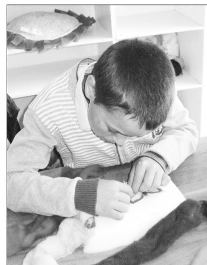
Занятия в кружке

Возвращаемся к теме нашего повествования. В 2013 году Центр реализовал новый проект «Живое тепло умелых рук», направленный на социализацию и самореализацию детей-инвалидов через творческую деятельность. А ныне сотрудники участвовали во всероссийской конференции фонда поддержки детей, находящихся в трудной жизненной ситуации, и единственные в крае выиграли грант. Проект предполагает создание площадки комплексной поддержки приемных родителей. Психологическая помощь будет оказываться специалистами-психологами из Красноярска; в то же время совместное творчество детей и родителей будет способствовать