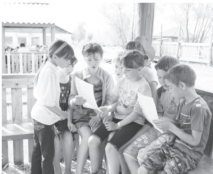
Пение на станции «Частушки»