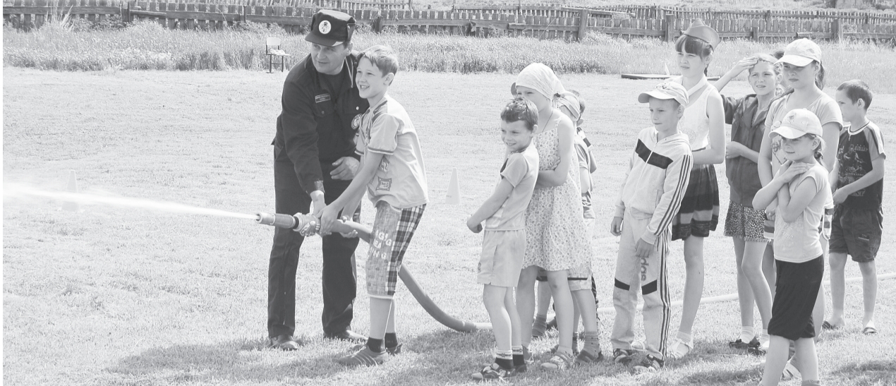
Дети сбивают мишень водяной струей

Огонь – спутник человечества с древнейших времен. Он согревал наших далеких предков, защищал их от диких зверей... Однако огонь может быть не только добрым другом, но и опаснейшим врагом.