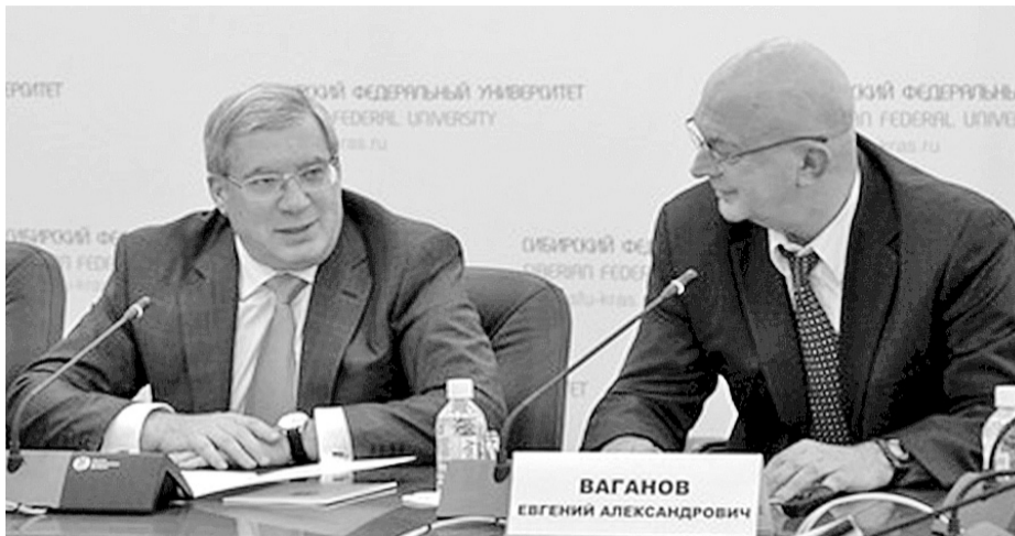
Виктор Толоконский принял участие в заседании совета ректоров вузов Красноярского края

дополнительное здание либо пристраиваем этажи, затраты снизятся почти втрое – до порядка 250 тысяч рублей за место. В Северо-Западном микрорайоне, где очень сложно найти место для строительства нового детского сада, а очередь большая, такое решение наиболее эффективно, – отметил Виктор Толоконский.