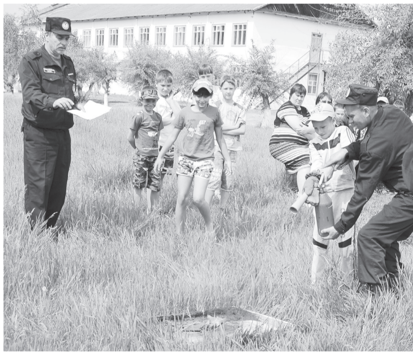
Тушение возгорания огнетушителем