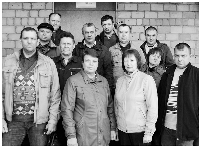
Коллектив линейно-технического участка Идринского района