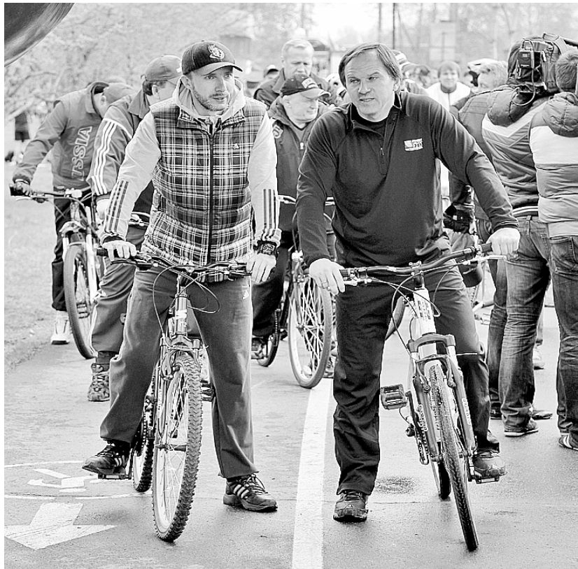
Здоровый образ жизни – здоровый образ мысли

– Болезненная тема. Недоумение объяснимо: раньше вроде власть рулила всем: и промышленностью, и торговлей, и «коммуналкой», а крайком партии и крайисполком умещались в одном здании. Но в этом недоумении есть доля лукавства. Даже школьники знают, насколько изменились общественные отношения в стране, насколько усложнилась законодательная база. Мы, конечно, документы не на машинках печатаем, но если бы людей, работавших здесь