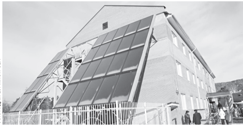
Энергоэффективный дом в Дивногорске – первый в нашем крае и третий в Сибири. Он во многом уникален